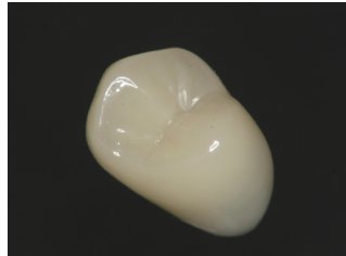
セラスマートプライム対応ブロック A1LT/A2LT/A3LT/A3.5LT/A4LT