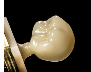
セラスマート 300 対応ブロック A2LT/A3LT/A3.5LT