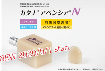
カタナアベンシア N 対応ブロック 色調 ML/A1/A2/A3/A3.5